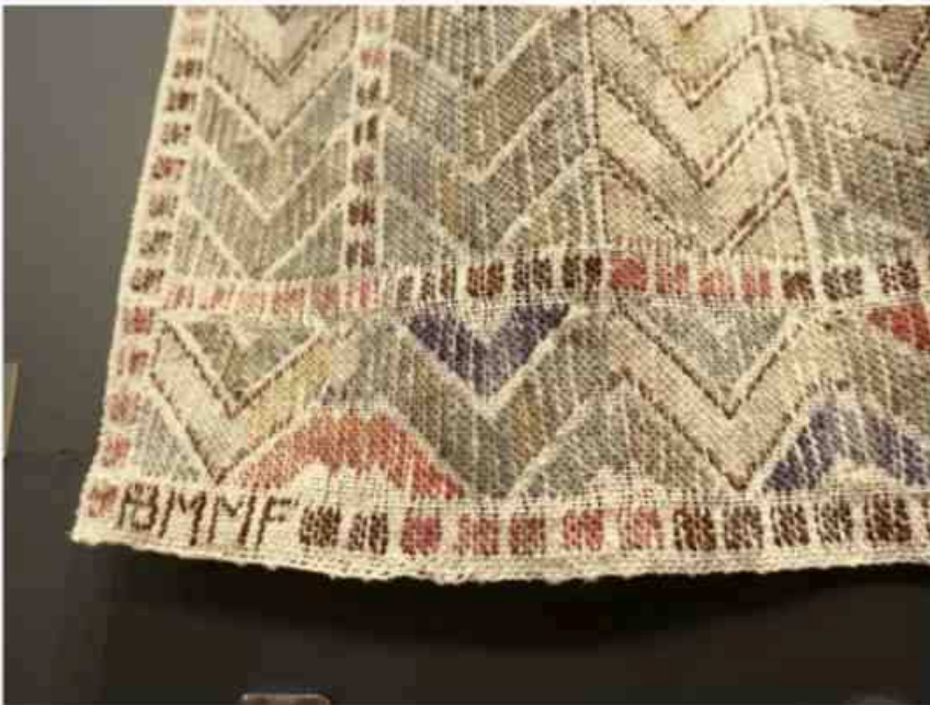
Martha Måås Fjetterstrøm