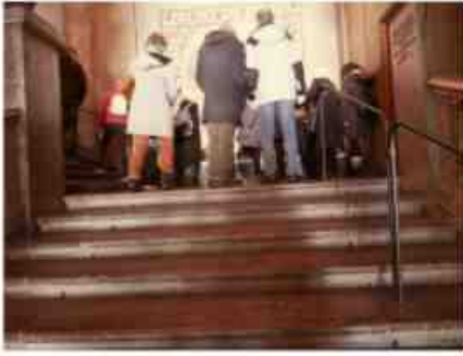
Formålet med turen var at se Martha Måas Fjetterstrøms udstilling på Kungliga Slottet